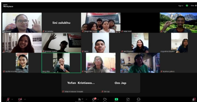
Gambar 4. Pelaksanaan PkM – “Cara Praktis Menyusun Bahan Ajar Sekolah Minggu”

Ice breaker melalui Quizizz menambah antusiasme peserta sekaligus memperkenalkan media digital interaktif. Setelah sesi tanya jawab, peserta mempraktikkan penyusunan bahan ajar secara berkelompok. Hasil praktik menunjukkan peningkatan kemampuan dalam merancang pembelajaran yang terstruktur dan berorientasi pada tujuan.